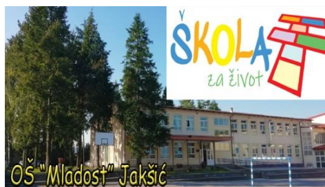
Energetska obnova OŠ Mladost Jakšić