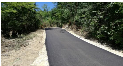
Izgradnja nerazvrstane ceste