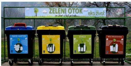
Uređenje zelenih otoka i izgradnja Reciklažnog dvorišta