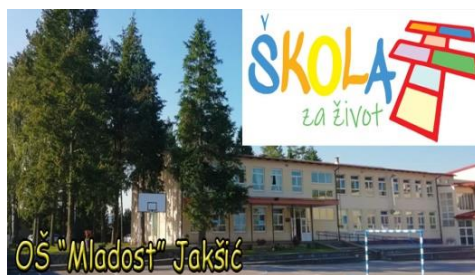
Energetska obnova OŠ Mladost Jakšić