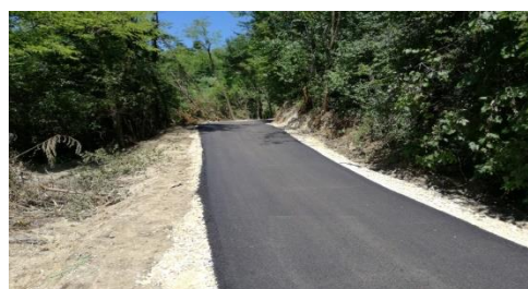
Izgradnja nerazvrstane ceste