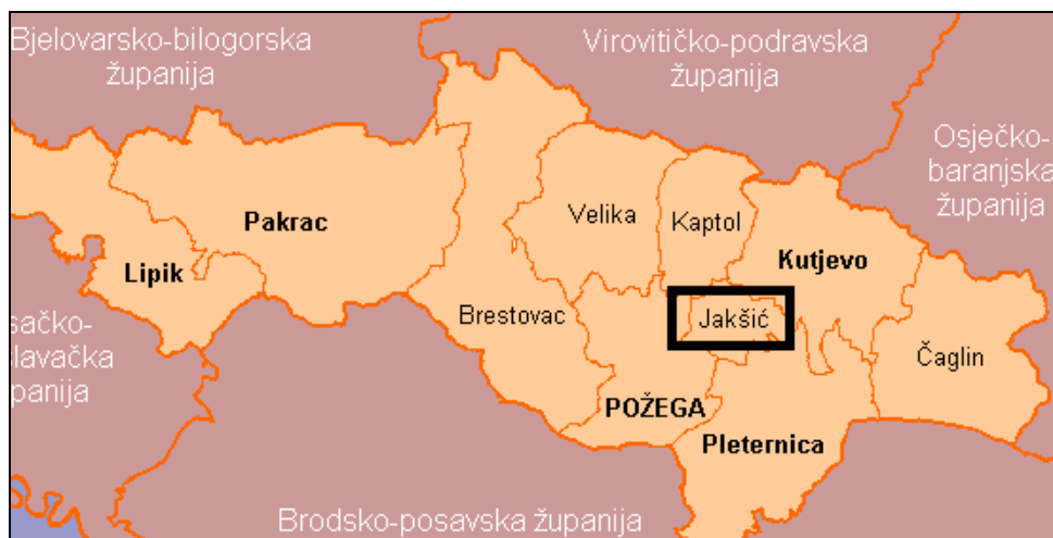
Slika 1: Administrativne granice Općine Jakšić unutar Požeško-slavonske županije

Općina Jakšić smještena je u središtu Požeške kotline i prostire se na 44,85 kvadratnih km. Općinsko središte je Jakšić, selo na cesti Požega - Našice, jedinica lokalne samouprave u Požeško-slavonskoj županiji. Jakšić je udaljen od središta županije, tj. Požege samo 7 km. Jakšićki kraj po središnjem položaju u Požeškom polju ima mnogo plodnih ravnica. Jakšić je smješten na blagom brdašcu, na mjestu gdje je u srednjem vijeku bilo naselje Sv. Đurđa (po crkvi sv. Đurđa). Općina Jakšić obuhvaća 10 naselja: Bertelovci, Cerovac, Eminovci, Granje, Jakšić Rajsavac, Svetinja, Tekić, Treštanovci i Radnovac, a prema posljednjem popisu stanovništva iz 2011.godine na području Općine Jakšić živjelo je 4.058 stanovnika u 1.210 kućanstava.