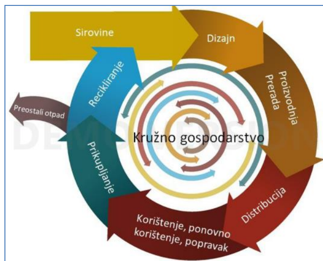
Slika 4: Model kružnog gospodarstva (Izvor: Plan gospodarenja otpadom RH 2017.-2022.godine)

Za prelazak na kružno gospodarstvo potrebne su promjene u cijelom lancu vrijednosti, od učinkovitog upravljanja resursima, dizajna proizvoda, novih poslovnih i tržišnih modela, novih načina pretvaranja otpada u resurse do novih modela ponašanja potrošača.