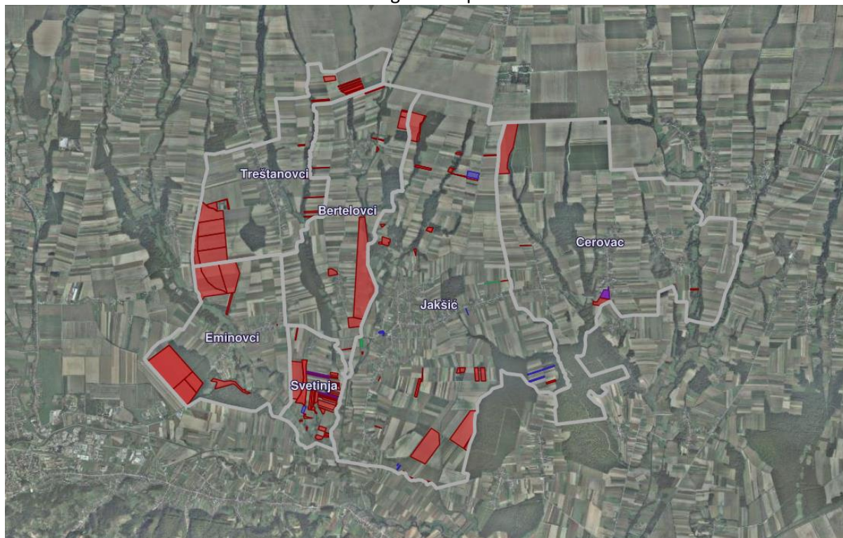
Slika 2: Državno poljoprivredno zemljište na području Općine Jakšić