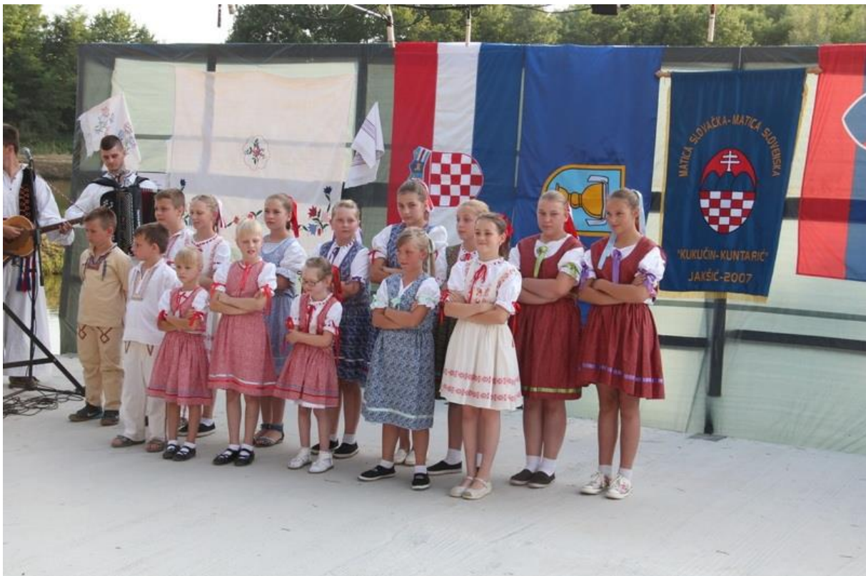
Slika 4. Manifestacija „Slovaci Slovacima“

Na području općine Jakšić se također organiziraju kulturne manifestacije, od kojih su najznačajnije „Pjesmom u jesen“ i „Slovaci Slovacima“. „Slovaci slovacima“ je manifestacija koja se održava u ambijentu Zelene lagune, rekreacijskog centra ŠRD-a Rajsavac, s pozornicom uz jezero i prirodnim amfiteatrom. 2015. godine je ova manifestacija održana 8. put zaredom. Ova manifestacija je svakako značajna za predstavnike slovačke nacionalne manjine, ali i za sve ostale građane, jer je to mjesto prezentacije i uvažavanja bogatstva različitoga, koje dolazi s ovih prostora ili iz različitih drugih krajeva Hrvatske i Europe, bilo da se radi o plesu, pjesmi, likovnom stvaralaštvu, poezije ili nekom drugom umjetničkom izričaju.