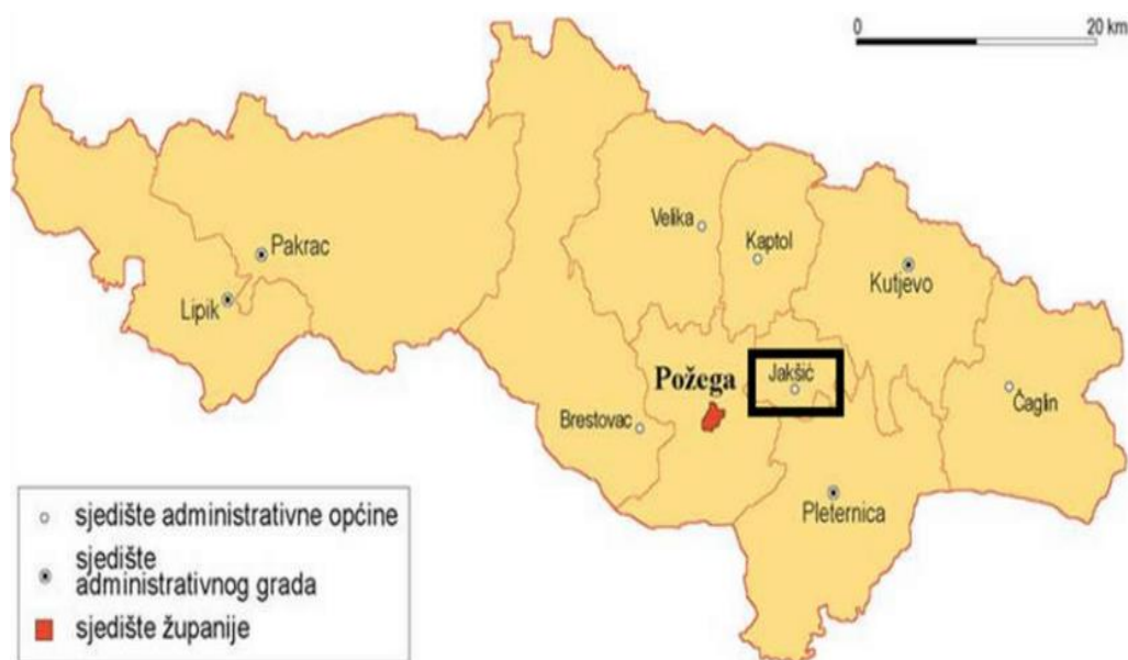
Slika 1. Administrativne granice Općine Jakšić

5