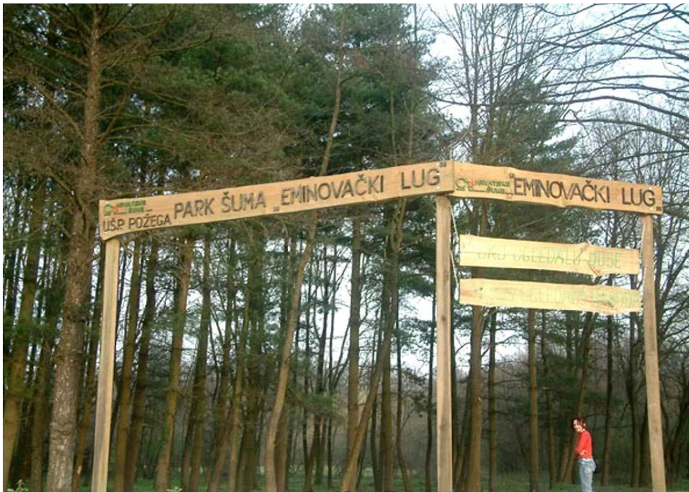
Slika 3. Eminovački lug