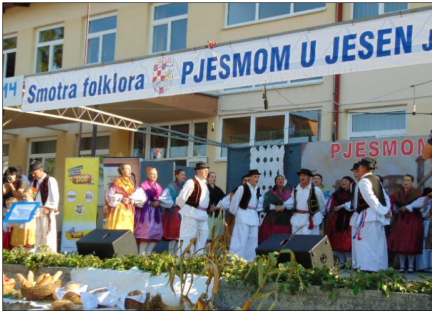
Slika 5. Manifestacija „Pjesmom u jesen“