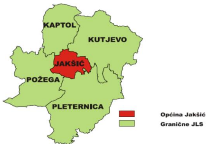
Slika 2. Jakšić i općine/gradovi

Izvor: Prostorni plan uređenja općine Jakšić, 2008. 8