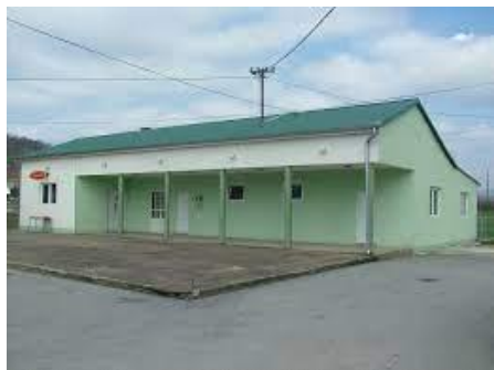
Uređenje i rekonstrukcija društvenog doma Cerovac